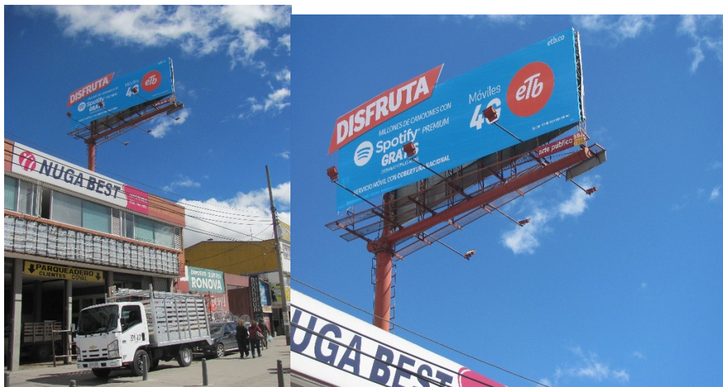
VISTA PANORÁMICA Y DE LA VALLA INSTALADA SENTIDO SUR - NORTE: ETB